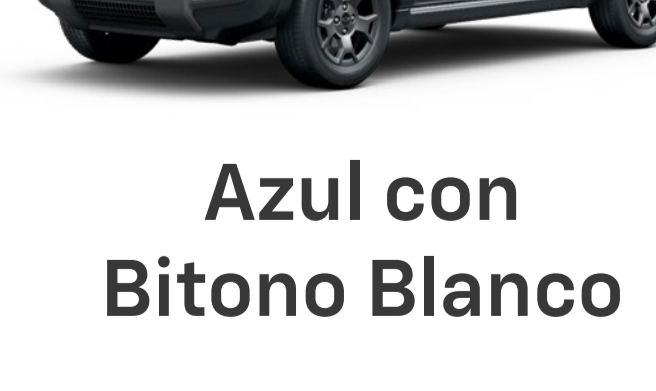
Azul con Bitono Blanco