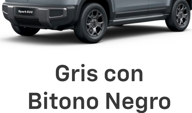
Gris con Bitono Negro