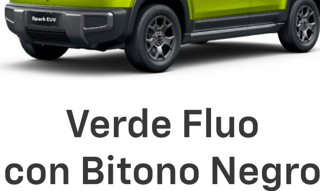
Verde Fluo con Bitono Negro