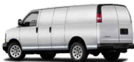
EXPRESS CARGO VAN