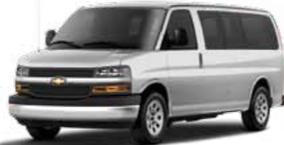
EXPRESS PASSENGER VAN