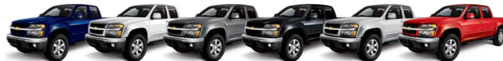
Azul Todo Terreno